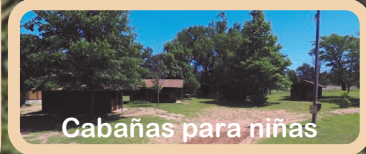
Cabañas para niñas