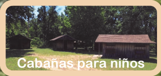
Cabañas para niños

Campamento Principal Comedor, refugio, casas de literas, y cabañas Cottonwood—camas para 18 (7 recámaras) Sunflower—camas para 35 (3 recámaras) Cabañas para niños—camas para 54 Cabañas para niñas—camas para 50