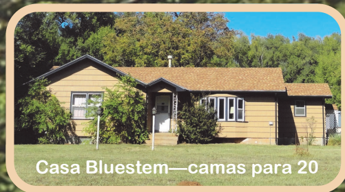
Casa Bluestem—camas para 20