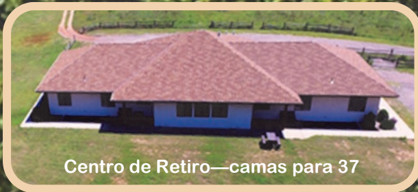
Centro de Retiro—camas para 37